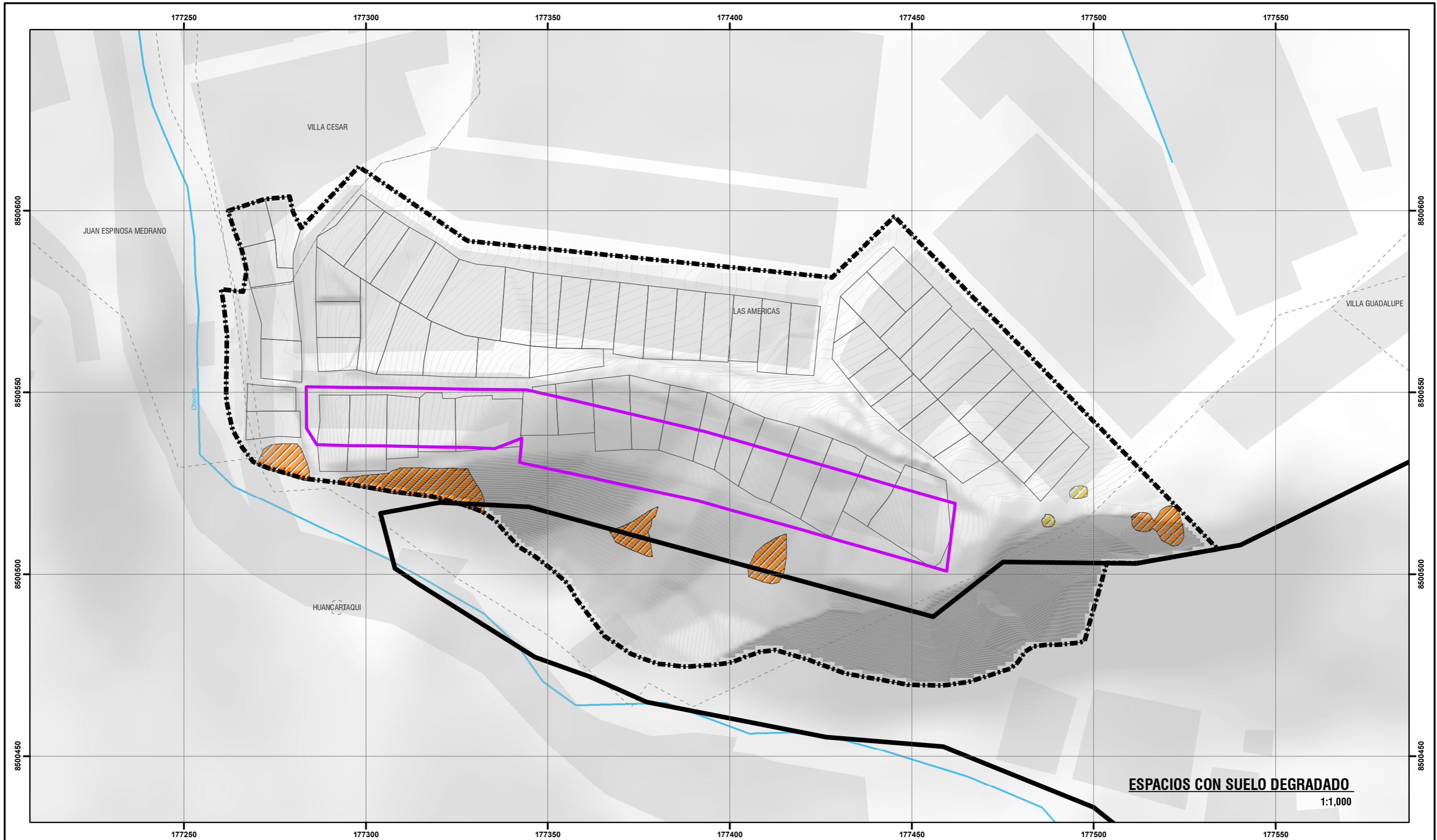
ESPACIOS CON SUELO DEGRADADO 1:1,000